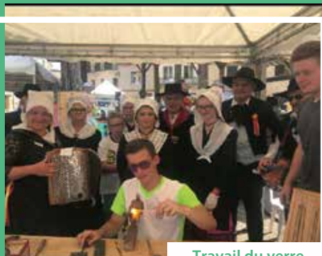
Travail du verre