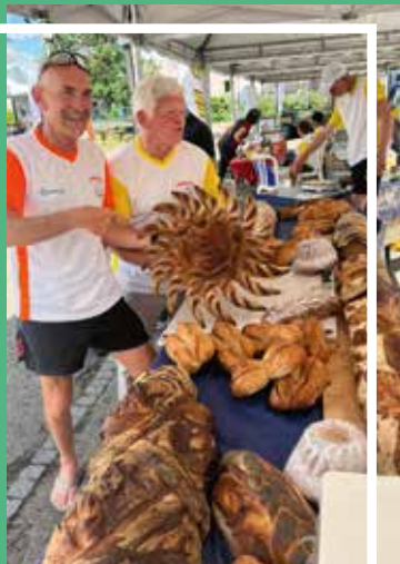
Magnifique exposition de pains de nos boulangers d'Alsace