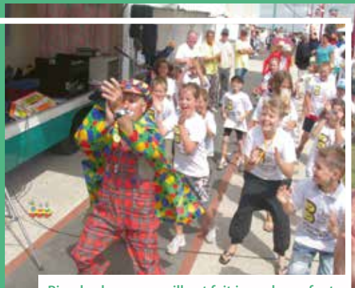
Pipo le clown accueille et fait jouer les enfants