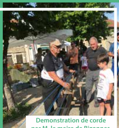
Démonstration de corde par M. le maire de Bizones

Pendant deux semaines des femmes et des hommes se relaient , ce qui donne à cette épreuve un esprit d'équipe avec des liens qui se tissent pour finir en apothéose de joie de sourires et de souvenirs gravés dans les mémoires