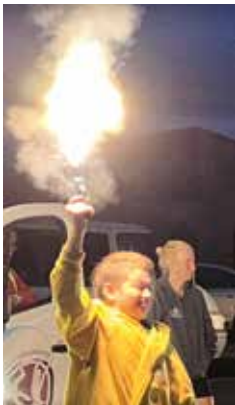
Départ tous les jours à 3h