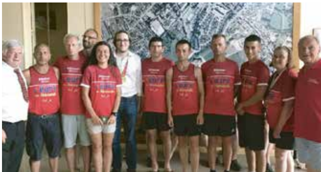
Le maire de Gisors et Président du Conseil Départemental accueille l'équipe de l'EURE.