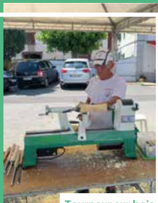
Tourneur sur bois